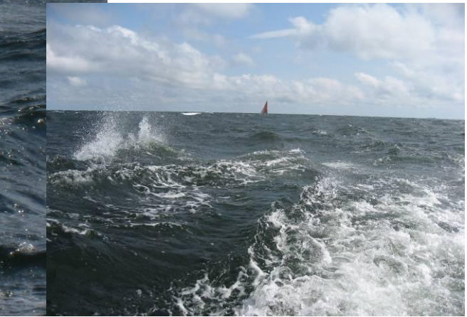
Kymmentä solmua kotiin